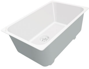
Cubeta blanca 8153 100